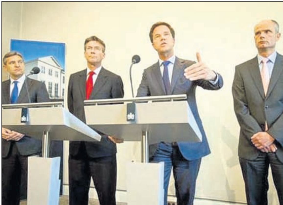
Premier Rutte lo entrega retiro di su gabinete awe tardi serca Reina Beatrix

ORANJESTAD – E deseo politico no tabata presente serca PVV y pesei nos ta para awe cu man bashi. Asina Prome Minister Mark Rutte di VVD a describi e situacion cu a surgi den fin di siman ora cu Wilders a kita su sosten di e gabinete den forma tolerante cu consecuencia cu e gabinete lo no por sigui su so.